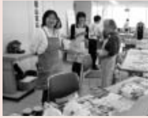
くじら共同作業所 和歌山友の会 かたつむりの店舗