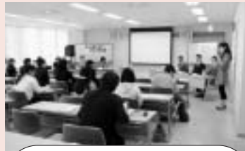
講座「県内企業と語ろう 男女共同参画」 就活事始〜話そう!仕事・知ろう!企業〜