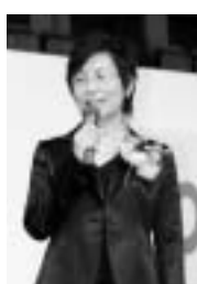
特定非営利活動法人子育て・あそびサポートぱお(海南市)

和歌山県主催「DV被害者ボランティア養成講座」の修了生を中心に設立された団体。女性の生き方を考える講座や研修会の開催や無料電話相談の実施など、女性の視点に立った活動を展開している点が高く評価されました。