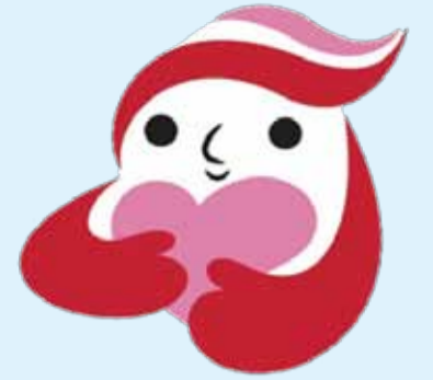
犯罪被害者等支援シンボルマーク 「ギュットちゃん」