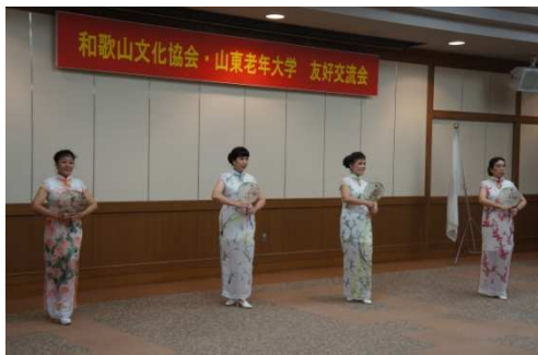
山東老年大学学生団による チャイナドレスショー

続いて、山東老年大学学生団が合唱や太極拳、バレエ、チャイナドレスショーなど中国文化を表す演目を披露し、日頃学校での学習成果を披露しました。