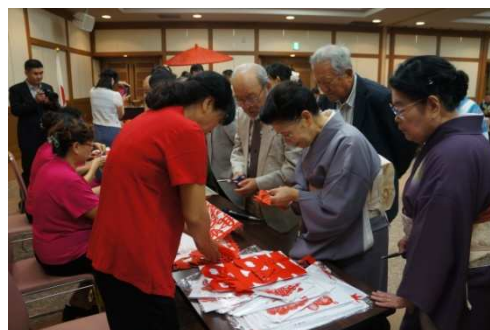
中国伝統手芸「切り絵」体験