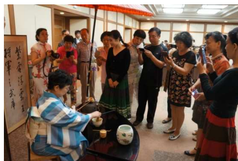
和歌山文化協会茶道部による茶道披露

スタートを切ったのは、中国山東省にある※山東老年大学との交流です。（※山東老年大学とは 1983 年に中国国内で初めて設立された高齢者教育機関であり、現在は約 19,000 人の学生が登録しており、書道、中国画、スポーツ、文学、声楽、舞踊等 60 もの専門コースがあります。）