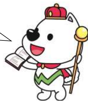
和歌山県PRキャラクター