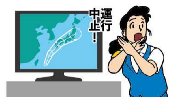
異常気象時等の措置