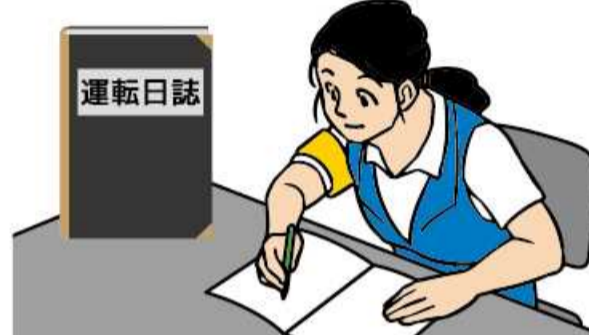
運転日誌の備付け