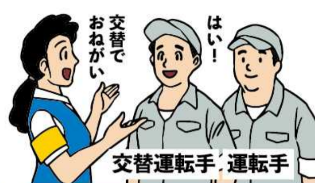
交替運転者の配置