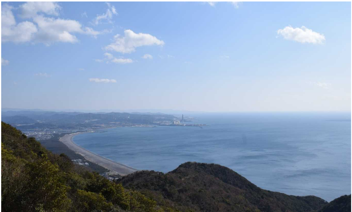
【弓なりに続く煙樹ヶ浜】

紀州鉄道は平均時速20km、ユックリ、ノンビリ、運行し、家の軒先をかすめるように進み、終点の JR 御坊駅0番ホームまで送り届けてくれます。