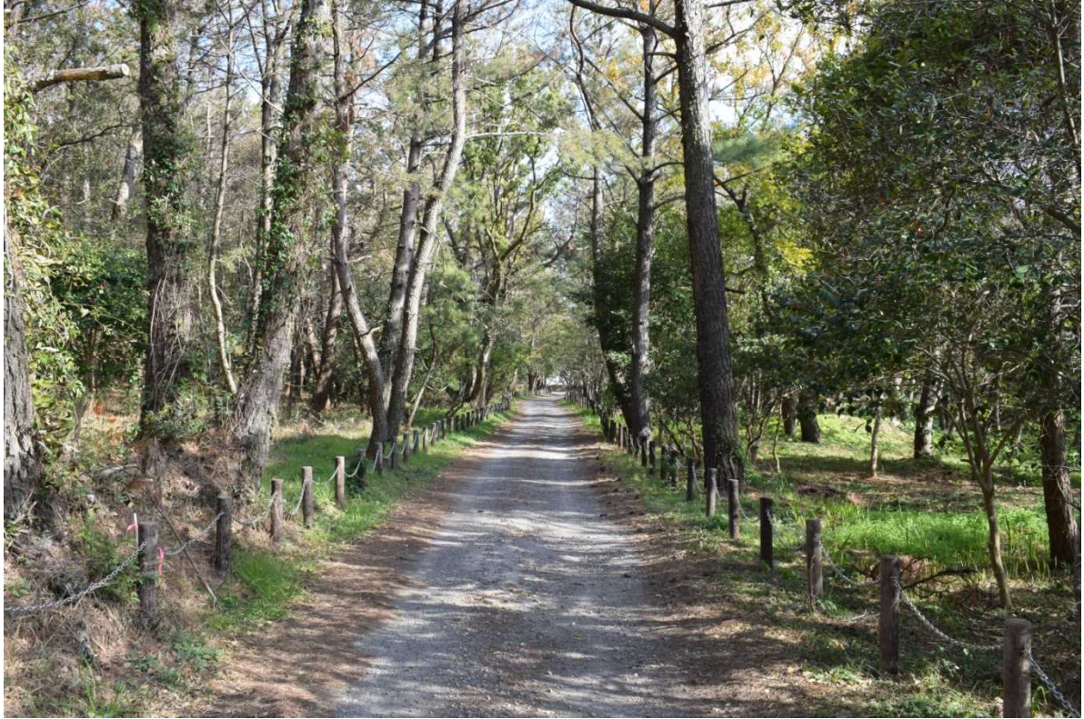
【400年以上を経ても見事な姿を見せる松林】