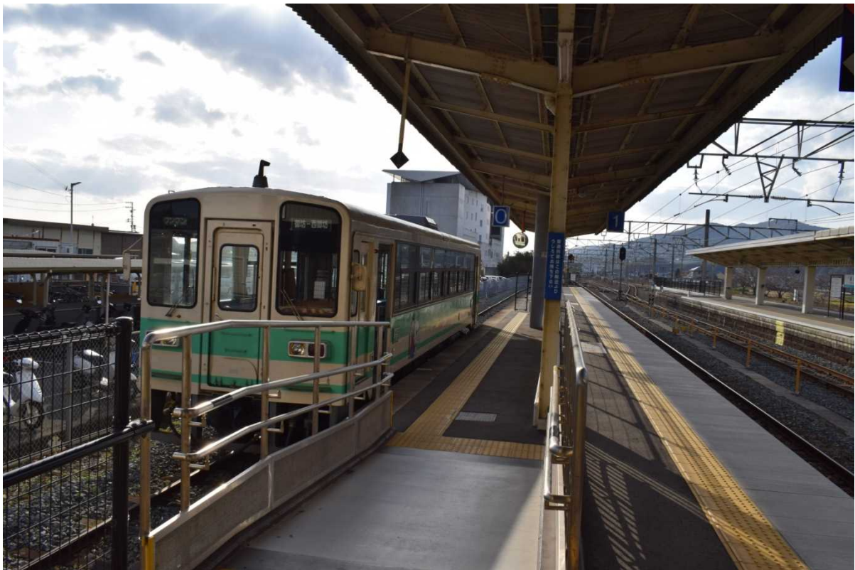
【JR 御坊駅で0番ホームに停車する紀州鉄道】