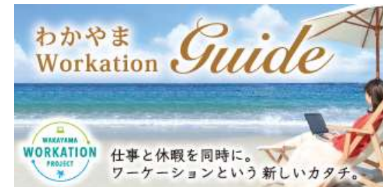
『いつもどおり』の仕事をしながら『いつもと違う』場所で『いつもと違う』経験や体験をすることができるワーケーション