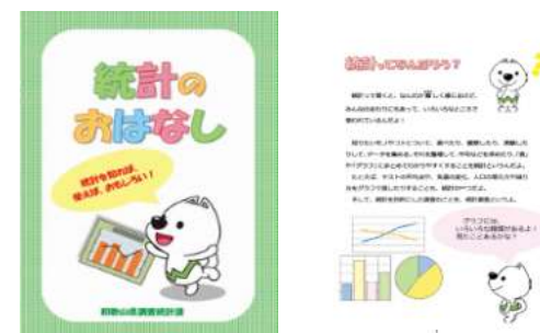
統計データ活用冊子「統計のおはなし」

和歌山県統計大会や出前授業等を開催するとともに、総務省統計局が実施する「キッズ向け統計イベント」に協力し、全国の子供達の統計リテラシーの向上にも貢献