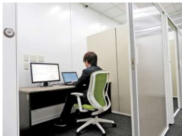
オンサイト施設における 統計マイクロデータの利用

統計マイクロデータや衛星データ等のデータ利活用環境の良さ、ワーケーション等の働き方に関する先進的な取組を生かし、データサイエンス人材が集う企業を創出