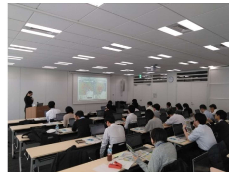
統計データ利活用研修会（令和元年12月）