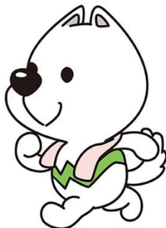
みんな実践！健康づくり運動ポイント事業