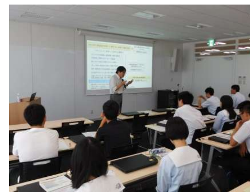
データ活用特別講義 (平成30年8月)

統計教育に関する教員向け研修を実施し、統計教育を充実、統計的な問題解決能力を身につけた未来のデータサイエンス人材を育成