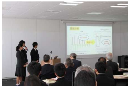
第3回和歌山県データ利活用 コンペティション (令和元年11月)

高等教育機関との連携やデータ利活用コンペティション等を開催し、データサイエンス人材を育成