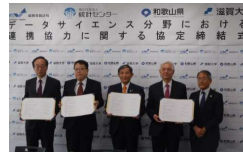
滋賀大学との連携協定 (令和元年11月)