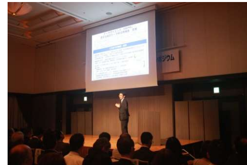
開設1周年記念シンポジウム (令和元年7月)