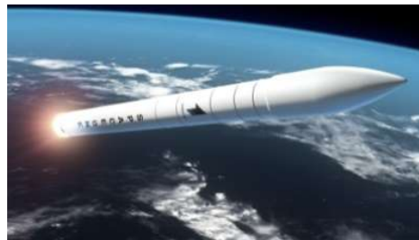
日本初の民間小型ロケット発射場の建設により、期待される衛星データ等の利活用