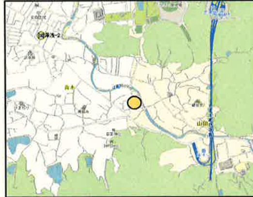
湯浅(県)-3 湯浅町大字山田字岩ノ谷10番12