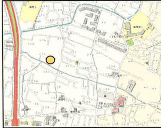
和歌山(県)3-1 和歌山市楠見中字北川280番