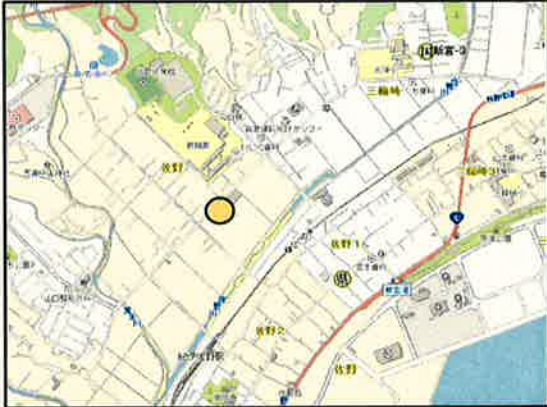
新宮(県)5-3 新宮市佐野字根地原975番5外