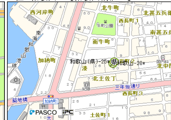
3位 和歌山-20[和歌山(県)-25]