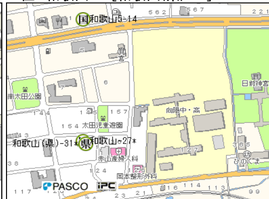
2位 和歌山-27[和歌山(県)-31]