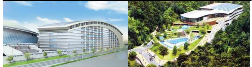
完成予想図 総合体育館(左) 県民水泳場(右)

国体開催を機に、老朽化が進んでいる県立体育館・武道館を総合的な屋内スポーツ施設として整備 ・メインアリーナ、サブアリーナ ・武道場