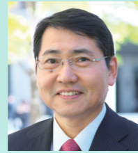
文部科学省 初等中等教育局視学官