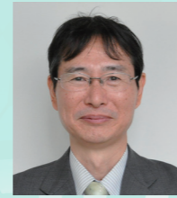
和歌山県企画部長