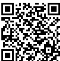
防災ナビアプリ QRコード