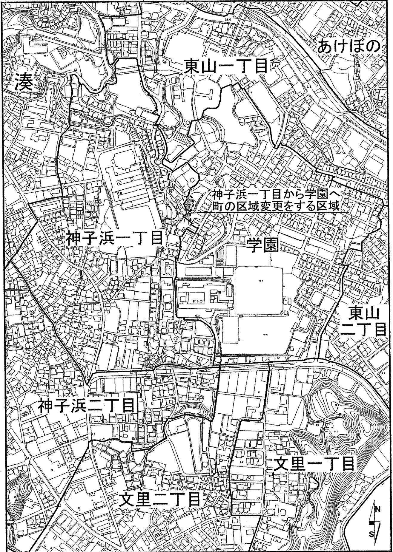
凡例 ■ ■ ■ ■ 変更前の町区域 ————— 変更後の町区域