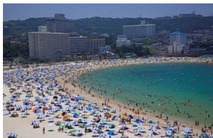
左図：整備中の白良浜海水浴場 右図：整備後の状況 (白浜町)