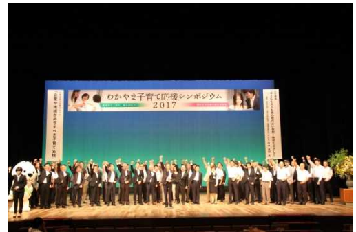
わかやま結婚・子育て応援企業同盟の皆さん

当日は、企業・市町村の関係者、一般参加者あわせて約1,200人のご参加をいただきました。このイベントを新たなスタート地点として、和歌山の子育て環境をより充実させていきます。