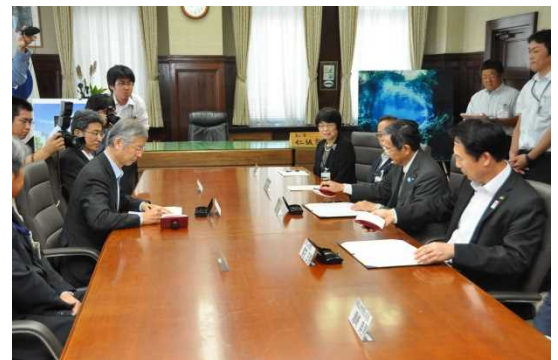
協定締結式の様子

このたびの協定では、県は薬学部の設置に必要な財政的支援と技術的協力を行うこと、和歌山市は県立医科大学に対し、薬学部設置に必要な用地の無償貸与を行うこと、県立医科大学は、県の医療発展に寄与する優れた薬剤師を養成すること、がうたわれました。