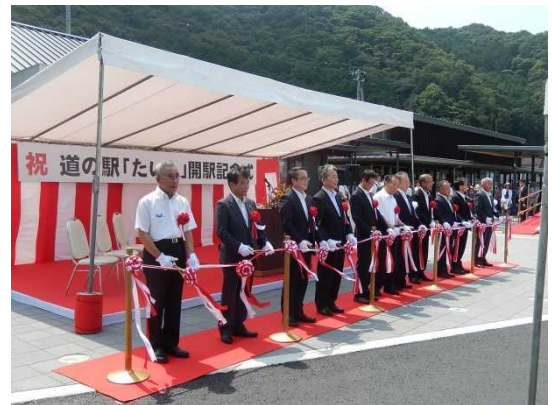
町長、来賓の方々によるテープカット

道の駅「たいじ」では鯨料理が味わえるほか、物産販売コーナーには地元の海産物や農産物が並び、鯨肉の加工品も豊富に揃います。