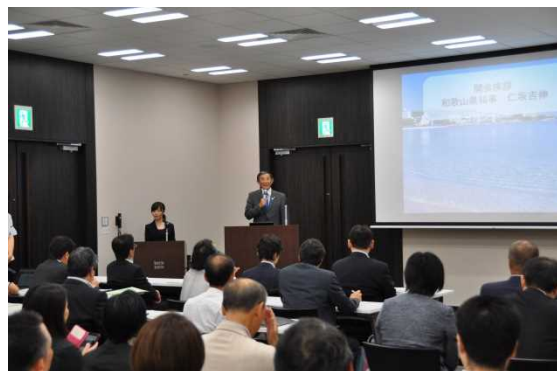
フォーラムの様子

今回のフォーラム開催により、参加された多くのICT企業等にワーケーションの魅力と、本県がその最たる適地であることを十分アピールできました。今後も、観光振興、企