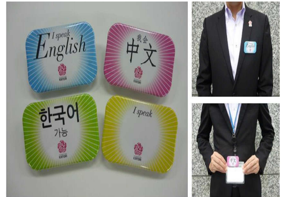
おもてなしバッジと着用例

このバッジには、英語や中国語、韓国語それぞれの言葉で「〇〇語話せます」と書かれています。これを着用することで、外国人観光客から、声をかけてもらいやすくしています。