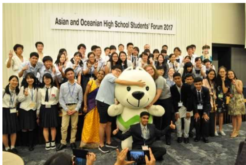
海外の皆さんとの交流が図られました

参加者の皆さんからは、研究課題の討論やプレゼンテーションだけでなく、世界遺産ツアーやレセプションなどの交流を通じて、たくさんの友人をつくり、大いに学ぶことができた有意義なフォーラムであったとの感想がありました。