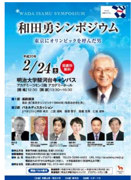
シンポジウムのチラシ