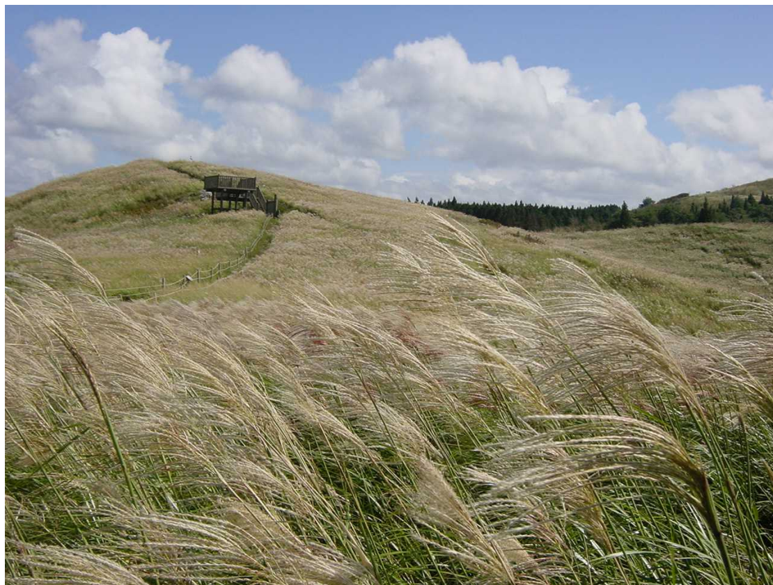
生石高原（紀美野町、有田川町）

標高870mの生石高原では、360度に広がる四季折々の草花に彩られた景色をご覧いただけます。秋には、金銀に輝くススキが織りなす、幻想的な風景が見ごろとなります。