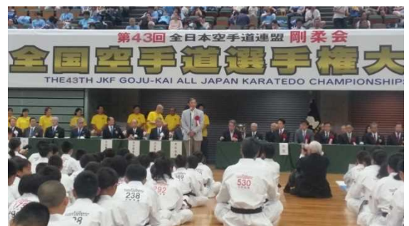
和歌山ビッグホエールにて