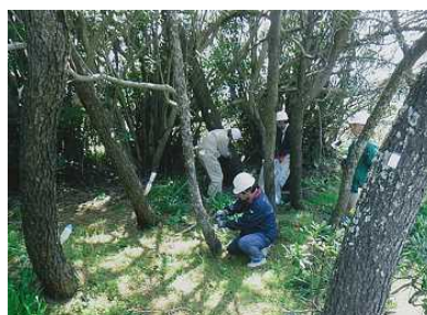
左図：薬剤の地上散布 和歌山市(和歌浦天満宮周辺) 右図：薬剤の樹幹注入： 串本町(橋杭海水浴場近辺)

※「 がん対策の充実 」、「 地元企業への就職を促進する奨学金返還支援制度の創設 」、「 わかやまのナショナル・トラスト 」を用途として指定いただいた寄附金については、ふるさと和歌山応援基金に積立て、平成29度以降に活用させていただきます。