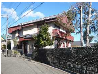
左図：宝来山神社(かつらぎ町) 右図：旧西村家住宅(新宮市)