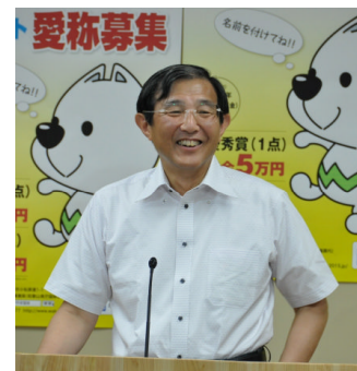
定例記者会見での仁坂知事