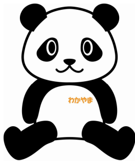
和歌山県観光PRシンボルキャラクター