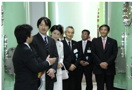
中野BC株式会社にて