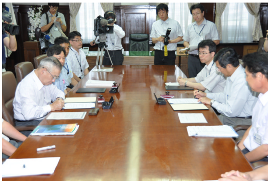
協定書にサインする仁坂知事と西村社長