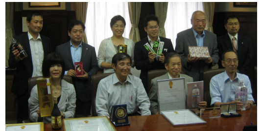
モンドセレクション受賞者25社40品（五十音順）