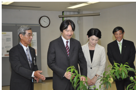
かき・もも研究所にて

・翌14日は農業コンクール開会式にご出席された後、中野BC株式会社（海南市）で梅酒の製造工程やJAありだAQ中央選果場（有田川町）でハウスミカンの選果工程などをご視察され、帰路につかれました。