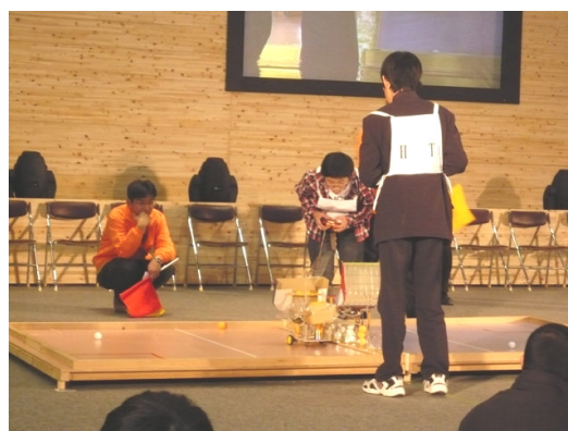
きのくに学生ロボットコンテストの様子