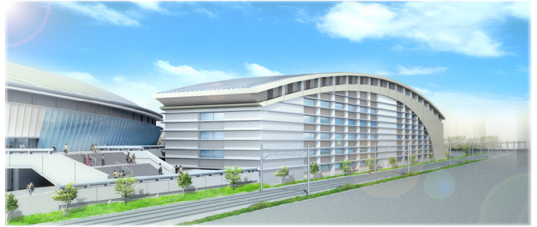
黒潮を泳ぐクジラ（既存施設（左）：ビッグホール）があげたビッグウェーブをイメージしています。

・この総合体育館には3つの機能があります。1つ目は、国体でのメインアリーナにおける体操・新体操・柔道、3競技の開催。2つ目は、建設が待ち望まれている武道場の機能。3つ目は、サブアリーナとしての機能。（国体の開催時には、ビッグホールや新しい体育館で競技を行います。その時の選手の練習場や控え室としての役割を担います。）