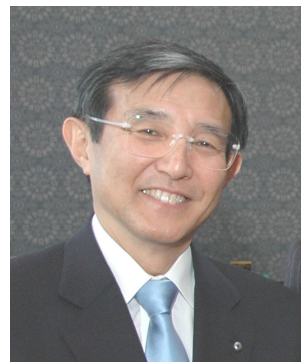
「平成22年 新年名刺交換会」 での仁坂知事。

県民の皆様が未来に希望を持てるように、平成22年度の新政策は「希望」に焦点を当てて編成していきたいと思っております。そして希望を持って頑張ろうとする県民の皆様を、私も、和歌山県も、必死で支えようと思っております。