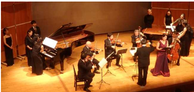
ファイナルコンサートの様子（指揮者：澤総監督）

10日の「今夜はオールベートーベン」では、ベートーベンが最も大切に編成の一つ、ピアノトリオ（ピアノ、ヴァイオリン、チェロ）により、最高傑作といわれる名曲「大公」が演奏され、厳格かつ優しく語りかけるようなメロディが会場に集まった皆さんの心に染みわたりました。