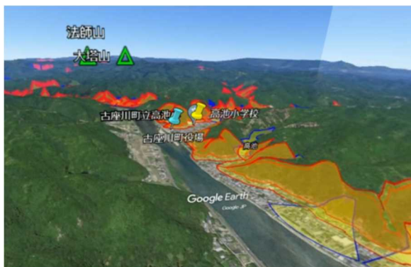
立体的な画像を見たい方向に動かせます

した、土砂災害警戒区域等の指定のための基礎調査の実施を加速させてきました。令和元年度に基礎調査が完了（21,879箇所）し、今年度中の区域指定完了を目指し取り組んでいるところです。