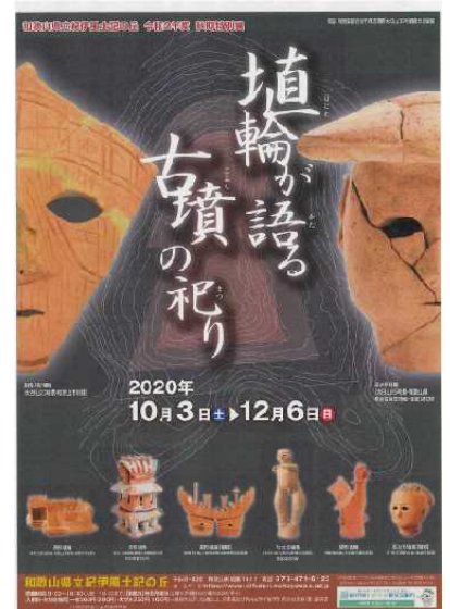
紀伊の主要な古墳の埴輪・土器を一同に御覧いただけます