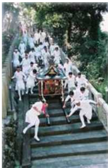
須佐神社の千田祭