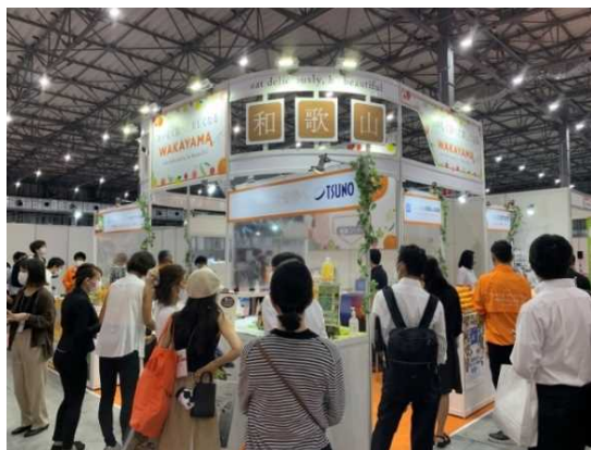
美容・健康業界のバイヤー達に県産食材をPRしました

9月15日～17日にかけて東京ビッグサイトで開催された、美容・健康業界のバイヤーが集う総合展示会「ダイエット&ビューティーフェア2020」に和歌山県が初めてブースを出展しました。