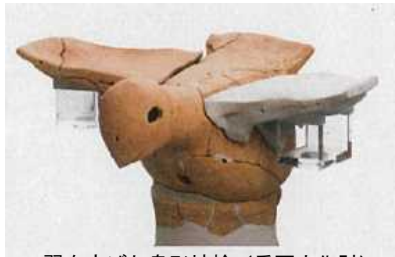
翼を広げた鳥形埴輪（重要文化財） 和歌山県教育委員会所蔵

墓に立てられているような埴輪を御覧いただけるとともに、重要文化財で全国唯一である大日山35号墳から出土した「翼を広げた鳥形埴輪」などの極めて貴重な埴輪をはじめ、紀伊の主要な古墳の埴輪・土器を御覧いただくことができる初めての展覧会です。