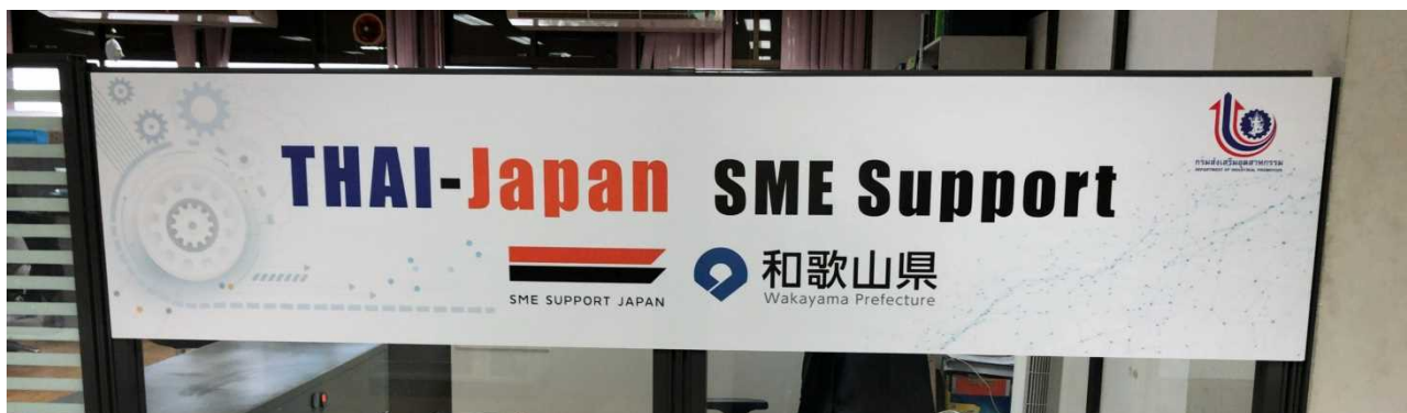
タイ王国の空の下、この看板を掲げお待ちしております！

アセアンの中心にあり、生産や商流の地域ハブとして今後も成長が期待されるタイ王国において、“Thai-Japan SME support 和歌山デスク”が県内企業の進出や経済交流、人的交流などの活動を強力にバックアップしてまいります。