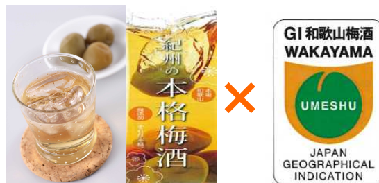
GI登録を契機に「和歌山梅酒」を盛り上げていきます

地理的表示とは、地域で長年育まれた伝統と特性を有し、その品質等の特性が生産地と結びついている農林水産物や食品の名称を、知的財産として保護するものです。