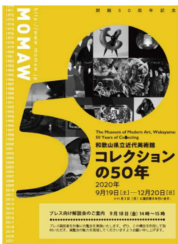
近代美術館の歴史が詰まった催しです

県立近代美術館では、開館50周年を記念した芸術の秋にふさわしい二つの美術展を開催中です。