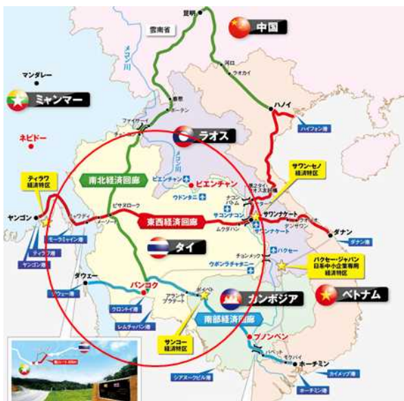
タイを中心に陸のアセアンを結ぶ経済回廊

タイは、2014年のインドシナ半島南部地域を東西に繋ぐ陸路「南部経済回廊」の整備後、世界有数の人口密度を誇る中国やインドへの玄関口となっており、バンコク空港から中東や欧州、アフリカ等とつながるアジアマーケットの「ハブ」機能を担う世界への輸出拠点として急速な経済発展を続けています。