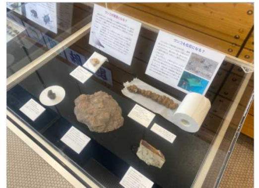
人間のものとそっくりな動物のウンコの化石など

普段、何かと遠ざけてしまいがちなウンコですが、自然界においては植物を育てる養分になり、また、その化石は当時の生き物がどんなものを食べていたかを知る手がかりとなる等、様々な役割を果たしてくれています。