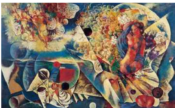
川口軌外《少女と貝殻》1934 油彩、キャンバス

和歌山県立近代美術館の50周年を記念して開催する本展は、和歌山県立美術館から引き継いだ作品と、その後半世紀にわたる活動の中で収蔵した約13000点から選りすぐった作品を通して、和歌山県立近代美術館のコレクションの歩みを辿るものとなっています。