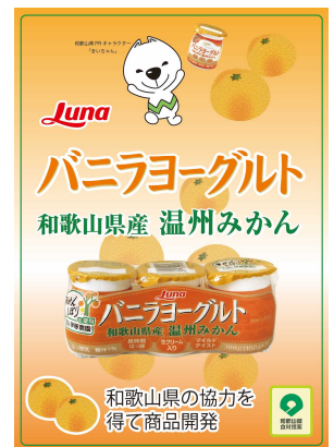
きいちゃんもおすすめですよ