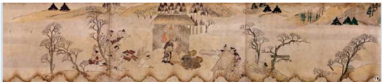
粉河寺縁起(国宝・粉河寺蔵)