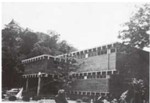
和歌山城内に建てられた和歌山県立美術館