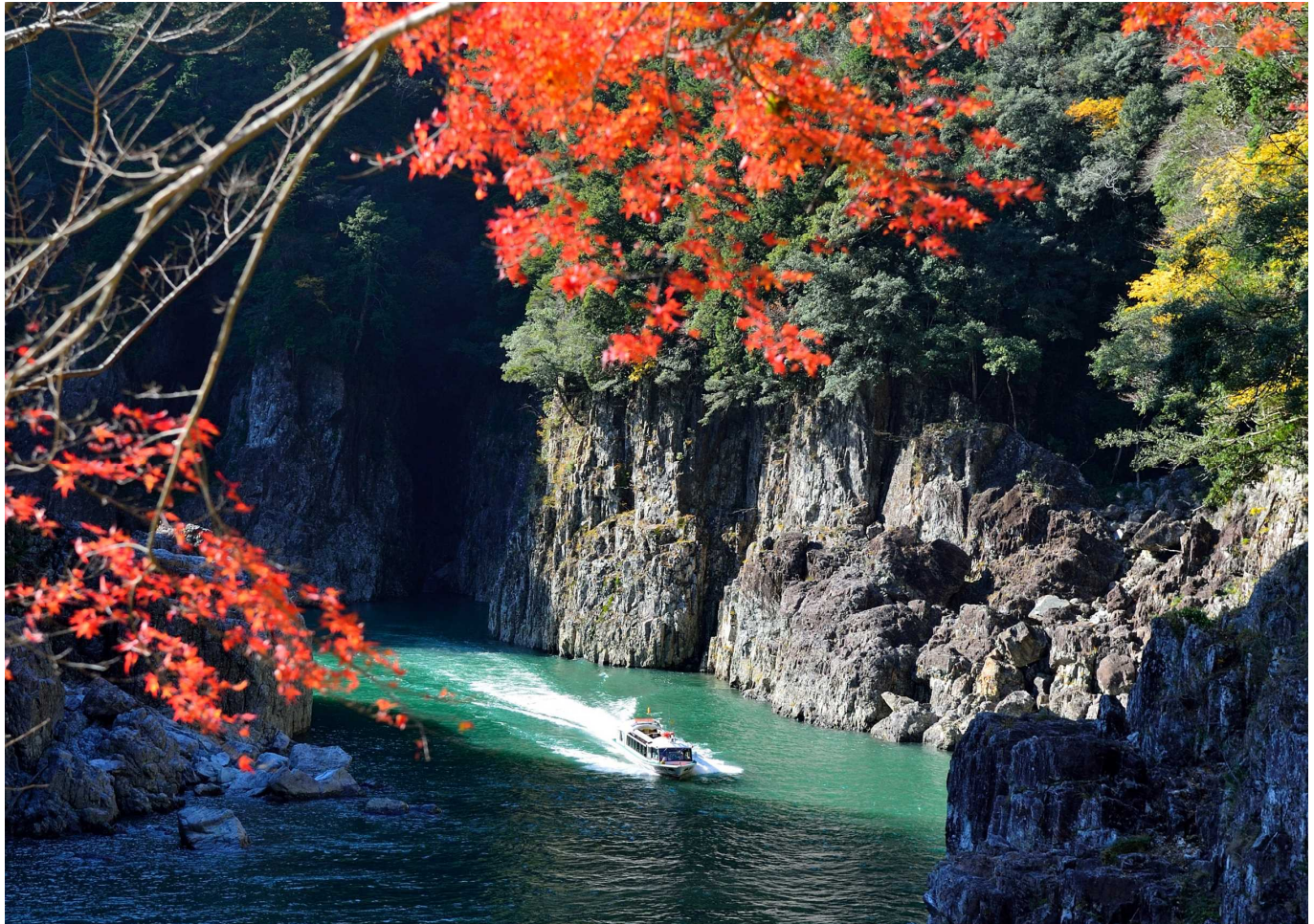
瀨峡（新宮市）

国の特別名勝に指定されている瀨峡は、マグマの熱で硬くなった地層が、その後の隆起によって北山川に浸食され、深い峡谷を形成したジオサイトの一つです。 時速約40kmで水面を滑るように航行する遊覧船から、両岸にそびえる巨岩、奇岩、断崖等を間近に御覧いただけるとともに、四季折々の大自然が生み出す渓谷美を満喫することができます。