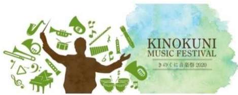
和歌山の秋を音楽で彩る

昨年、和歌山で産声を上げた、県民参加型の本格的な音楽の祭典「きのくに音楽祭」が今年も開催されました。