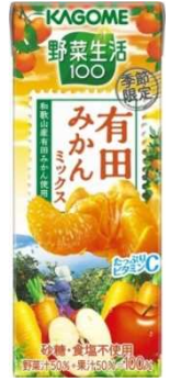
「有田みかんミックス」

展示会では、飛沫感染防止フィルムの設置や通路の確保等、新型コロナウイルス感染症拡大防止対策が講じられる中、和歌山県ブースには多くのバイヤーが訪れ、セミナーでは多くの方々に県産柿を中心とした本県農産物の魅力を紹介しました。