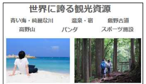
ワークーションの適地和歌山

ワークーションの適地和歌山 誇る動物園など、休暇を充実させるにはぴったりの観光資源も揃っています。