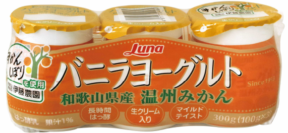
温州みかんの風味が香るバニラヨーグルトです

この度、日本ルナ株式会社から、今年春の「南高梅」果汁を使ったヨーグルトに続いて、和歌山県産温州みかんの果汁を使った商品が販売されています。