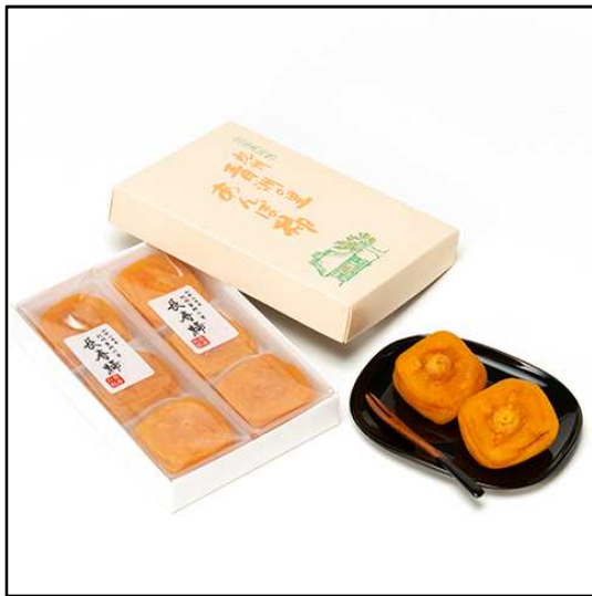
プレミアム和歌山認定商品「長寿柿」 (株式会社パーシモン)

秋には県北部を流れる紀の川兩岸の丘陵地帯で、大きく色づいた柿が辺り一面を彩ります。少し先になりますが、是非、秋の風情を味わいに和歌山へお越しください。