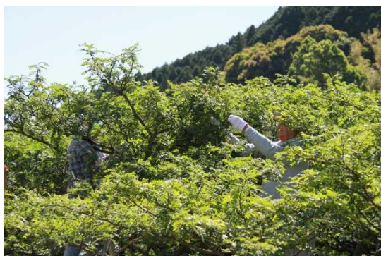
5～6月に収穫時期を迎えます

今後も食品メーカーとの協力商品の販売を推進し、和歌山県産品の魅力を発信してまいります。