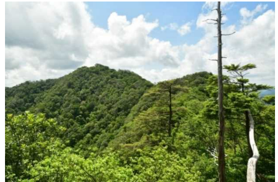
紀伊半島の特徴的なブナ林が広がる大塔山

本県にはたくさんの文化財や史跡、山岳、高原、滝、渓谷、海岸等、素晴らしい風景があります。「自然公園」はこれらの風景地を指定するもので、優れた自然の風景地を未来に残し、そこにいる生物を保全するとともに、これを秩序立てて広く利用してもらおうという趣旨のもと、指定されます。