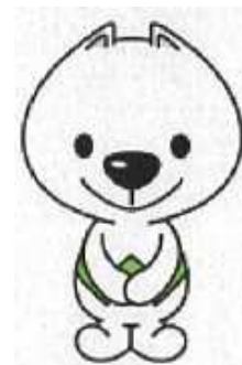
ありがとうございました