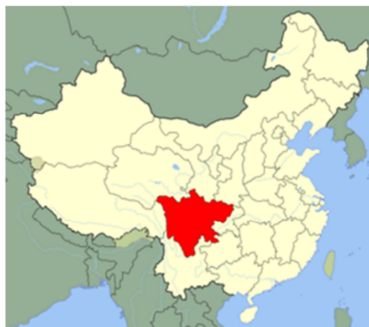
『三国志演義』の蜀の国としても有名です

本県ではこれまで、中国山東省と昭和59年に友好都市関係を締結しており、36年にわたる交流を続けているところですが、四川省との「パンダが結ぶ友好関係」も末永くお互いの発展に寄与するものとなるよう1月の友好都市関係締結に向け取り組んでまいります。