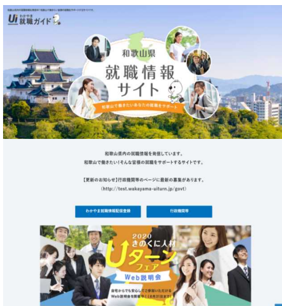
検索機能も搭載しています

一方、5月25日から開始している「きのくに人材UターンフェアW e b説明会」では、ウェブサイト「U Iわかやま就職ガイド」内に参加企業(62社)の採用情報とP R動画を掲載し、視聴した方がメール等により企業の採用担当者にコンタクトが取れる場を提供しました。