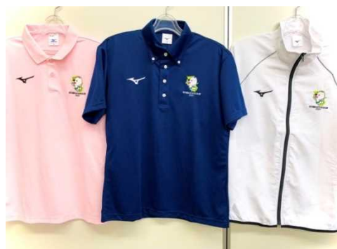
カラー、刺繍の種類等、公式ウェブサイトをご覧ください

和歌山市では、現在建設中の新市民会館「和歌山城ホール」の工事現場の囲いに県内の生徒の美術作品をあしらったPRシートを設置しています。PRシートには、紀の国わかやま文化祭2021と同年に開催される「第45回全国高等学校総合文化祭（愛称：紀の国わかやま総文2021）」の大会名、キャッチフレーズ等が描かれ、その両側には、和歌山県立和歌山ろう学校高等部の生徒の作品「和歌山のクジラに乗って、芸術文化を实らそう！」と和歌山市立高等学校の生徒の作品「風そよぐ森」が掲示されています。若者らしい爽やかな作品は、街ゆく人々に芸術を表現する楽しさを伝えてくれています。