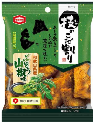
おつまみにもピッタリです

昨年御紹介いたしました株式会社オークワの創立60周年を記念した独自商品として、ニッスイ（日本水産株式会社）から発売された『しびれ鍋つゆ』に続いて、本県が収穫量全国第1位を誇るぶどう山椒を使った新商品が5月18日から販売されています。