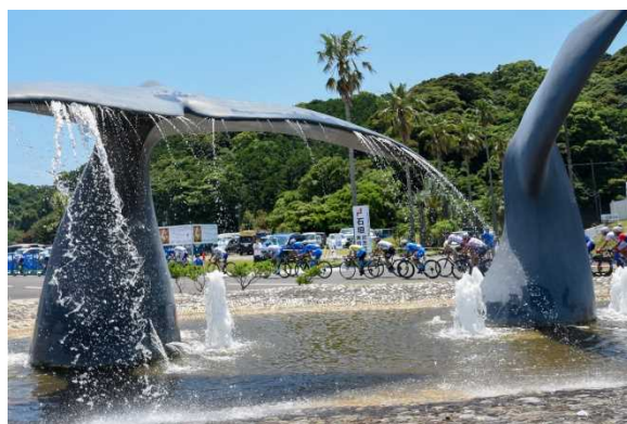
自転車が和歌山ならではの景色の中を疾走します