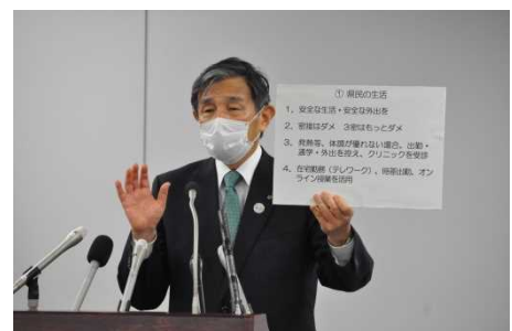
5/15 南別館記者会見室にて