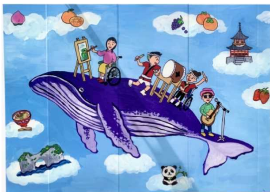
作品「和歌山のクジラに乗って、芸術文化を实らそう！」