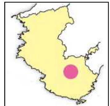
この辺りに位置します

大塔山県立自然公園は、紀伊半島南部の中核をなす山岳地帯で、大塔山と法師山を主峰とした大山塊を形成しています。急峻で落差の大きい滝や廊下と呼ばれるY字状の渓谷等、特有の地形が見られ、県内屈指の山地景観を呈しています。また、大塔山を源流とする美しい渓谷や滝が形成され、水と緑が織りなす絶景が広がっています。