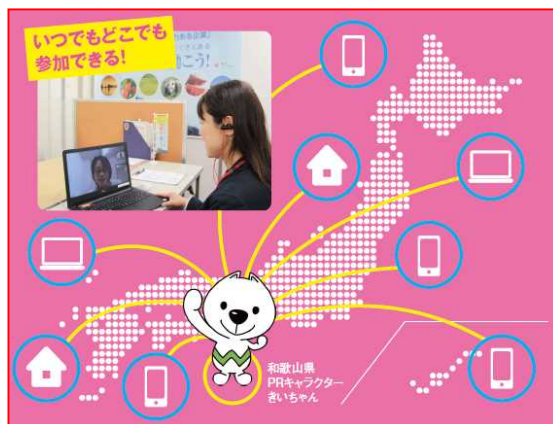
全国どちらからでも参加いただける会となりました

・ URL : https://kokucheese.com/event/index/595569/