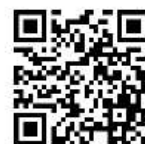
公式ウェブサイト

公式ウェブサイトの販売店を掲載しておりますので、是非、お買い求めいただければと思います。