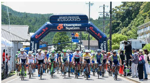
TOUR de 熊野のスタートの様子

があると認められる個人又は団体を表彰する「自転車活用推進功績者表彰」を受賞されました。