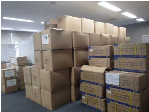
皆さんからいただいたたくさんの支援物資

へへの医療や看護に奮闘してくれた医療関係者の皆さん、また、感染拡大防止のため自粛に努めていただいた県民の皆さんに、心からお礼を申し上げます。