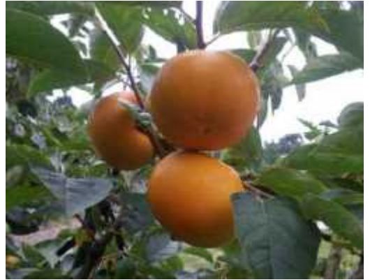
大玉で美味しい新品種「紀州てまり」

本県では、平成29年に開発した甘がき新品種「紀州てまり」の早期産地化を進めており、今年の秋には試験出荷を始め、令和5年秋の本格出荷を目指しています。今後も柿産地としての和歌山の名をさらに盤石のものとしてまいります。