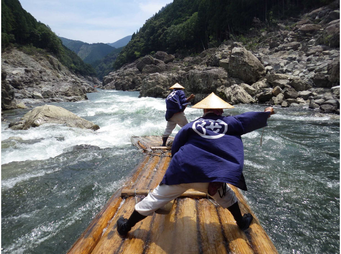
北山川観光筏下り (北山村)

筏流しは、切り出した木材を筏に組み、川を流して下流の新宮市まで運搬する手段でした。この筏を造る技術と筏を操る技術を受け継いでいるのが北山川観光筏下りです。筏師が造る筏に乗り、大自然の中を人力だけで下るのは、ここ北山村だけです。新型コロナウイルス感染症の影響で、5月から運休となっていましたが、7月1日から運航を開始する予定です。 是非、暑い夏に、川を下るスピードとスリルで「涼」を感じていただければと思います。