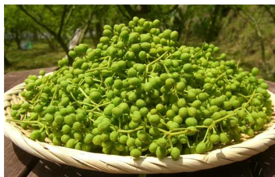
「緑のダイヤ」と呼ばれるぶどう山椒の実