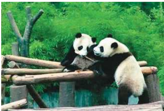
四川省ジャイアントパンダ保護区（世界遺産）の様子