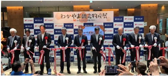
石田総務大臣と主催者等によるテープカットの様子