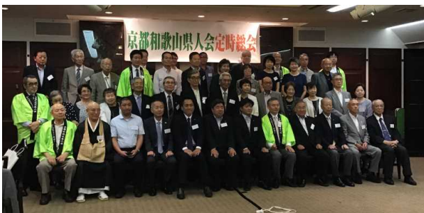
京都和歌山県人会の皆さん