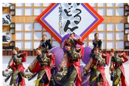
おどろんや 紀州よさこい祭り