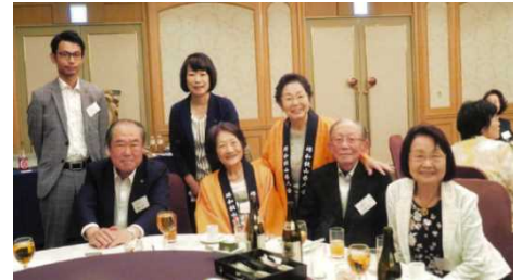
堺和歌山県人会の皆さん