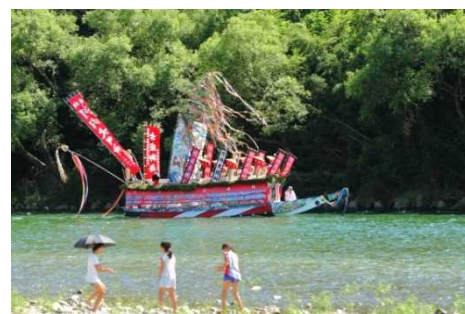
河内祭の御船行事