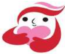
犯罪被害者等支援シンボルマーク 「ギョットちゃん」

本県では、犯罪被害者等の権利を保護し、被害の軽減と早期回復を図るため、「和歌山県犯罪被害者等支援条例」を本年4月から施行しました。