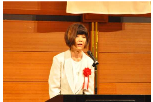
長谷川氏による代表謝辞の様子