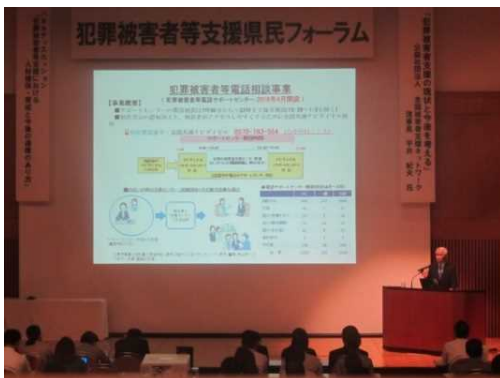
平井理事長による講演の様子

なお、現在、特化条例を制定している都道府県は17道府県で、このうち、貸付金制度を設けているのは本県を含め3県のみです。また、県内で支援条例を制定している市町村は上富田町のみとなっております。今後、他の市町村にも支援強化を呼びかけてまいります。