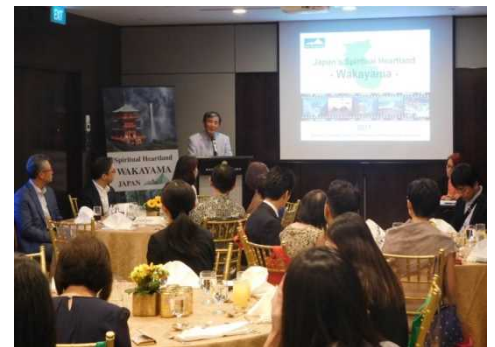
和歌山プロモーションの様子

知事、後藤観光交流課長及び赤坂食品流通課長が英語でプロモーションを行い、本県の観光及び県産品の魅力を紹介するとともに、引き続いて実施したネットワーキング(交流会)において、参加者と積極的な意見交換を行いました。