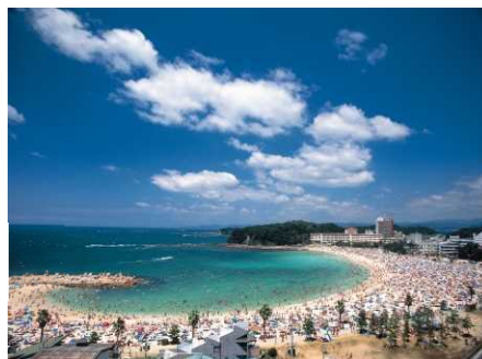
左図：整備中の白良浜海水浴場 右図：整備後の状況 (白浜町)