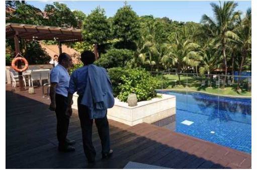
リゾート・ワールド・セントーサにて

なお、シンガポールでは年間のインバウンド約2000万人のうち、3分の1程度がリゾート・ワールド・セントーサを訪れています。シンガポールではカジノ