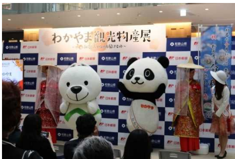
オールわかやまフォトセッションの一幕