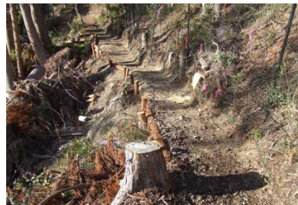
熊野参詣道中辺路