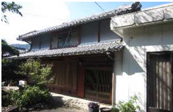
ふるさとに手つかずの家屋はございませんか？

現在、適切な管理が行われていない空き家が、防災、衛生、景観等の地域住民の生活環境に深刻な影響を及ぼしていることが多く、地域住民の生命・身体・財産の保護、生活環境の保全、さらには、空き家の活用のために対策が必要となっています。また、東京や大阪で暮らしながら、ふるさとの実家が空き家になっている方もいらっしゃると思います。