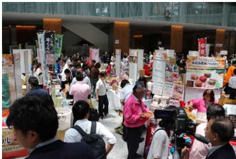
賑わう会場の様子