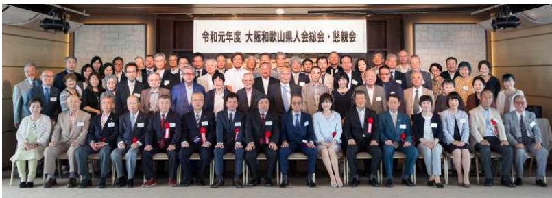
大阪和歌山県人会の皆さん

一方、大阪、堺、京都県人会では田辺市職員による梅酒の試飲コーナーが設けられ、数種類の梅酒の試飲することができ、気に入ればその場での購入申込みやふるさと納税の申込みも受け付けていました。京都、在京県人会では、県庁税務課の職員が、ふるさと納税の受付コーナーを設けさせていただき、ご寄付いただきました。各県人会の皆様ありがとうございました。