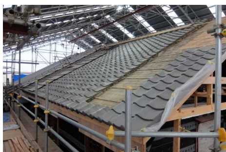
左図：十六羅漢像（浄教寺蔵） (有田川町) 右図：旧西村家住宅（新宮市）