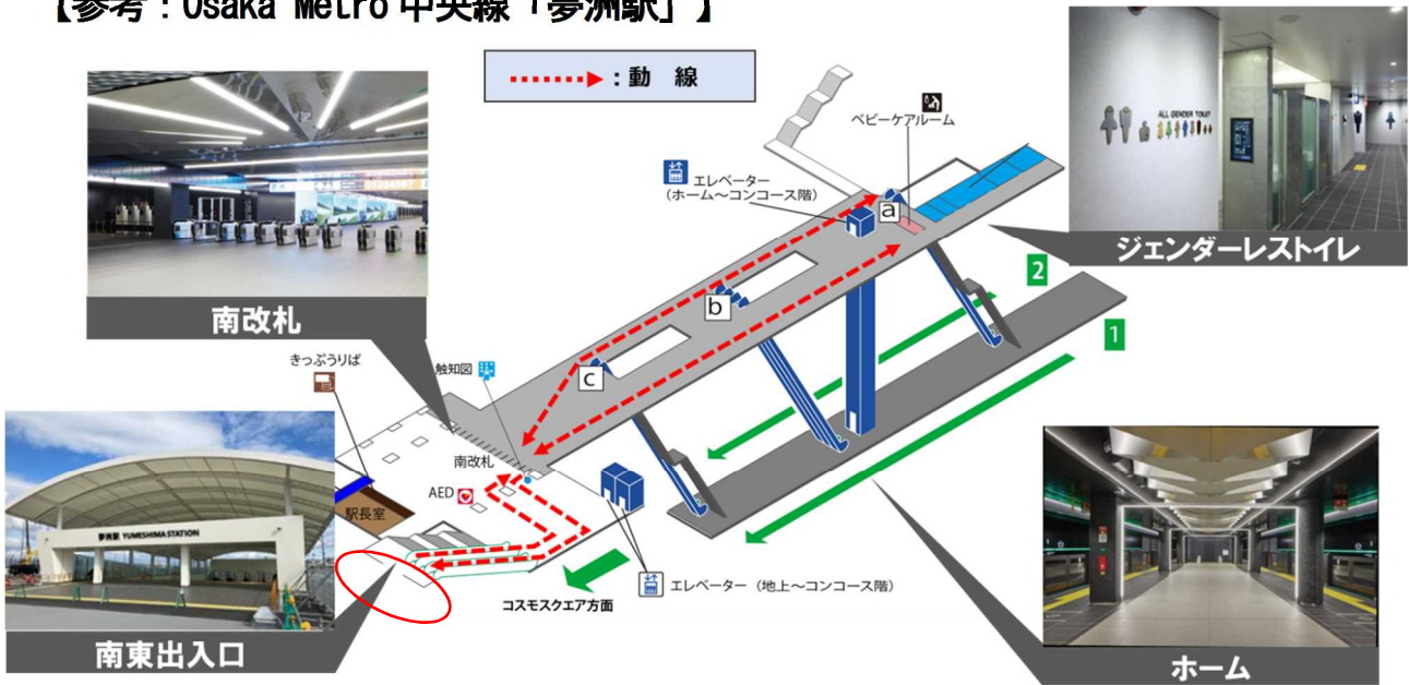
<構内写真①：南改札前広場（構内）から南東出入口（構外）に向けて>