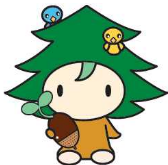
第62回全国植樹祭シンボルマーク「キノピー」