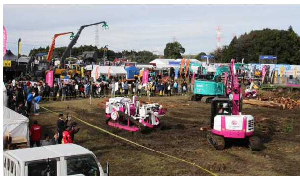
(令和 5 年 茨城県)