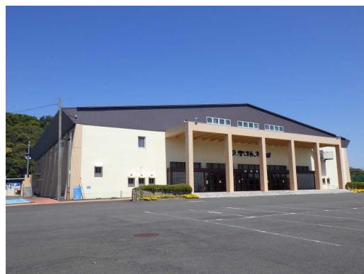
写真 2 白浜会館