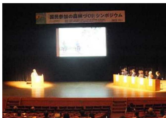
(令和 5 年 茨城県)