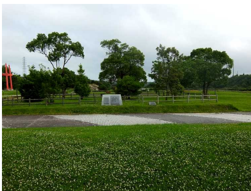
写真 1 新庄総合公園