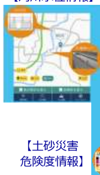
【土砂災害危険度情報】