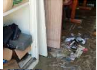
【和歌山市 紀三井寺】