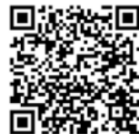
専用WEBサイトQRコード