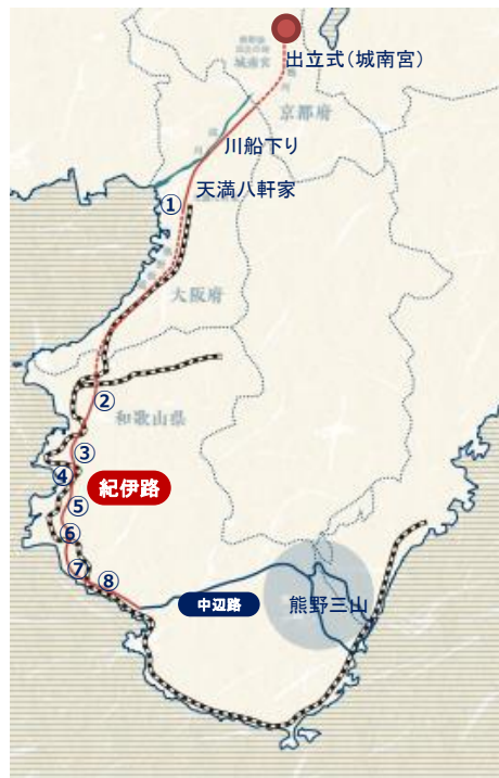
熊野古道リレーウォーク計画図