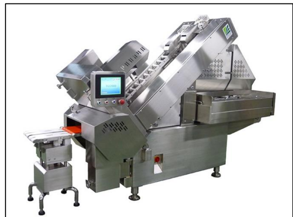
ハム・ベーコン用スライサー