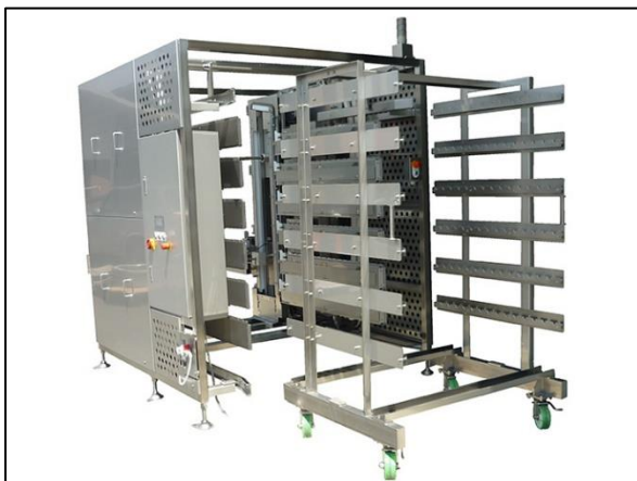
ウインナー自動竿積載装置