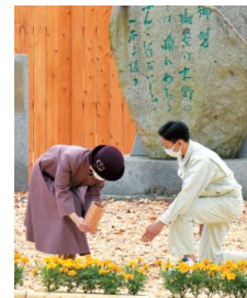
お手入れ行事（写真左：枝打ち、写真右：施肥）