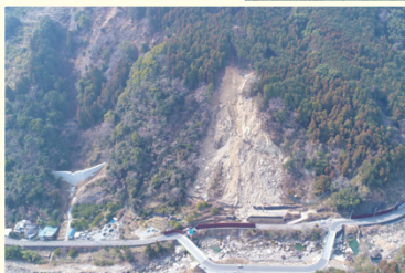
紀伊田辺地区民有林直轄治山事業