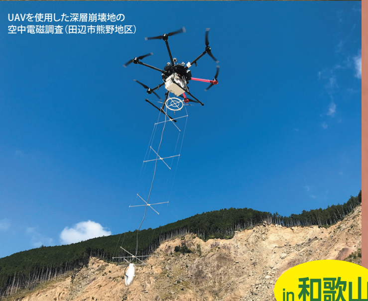
UAVを使用した深層崩壊地の 空中電磁調査(田辺市熊野地区)