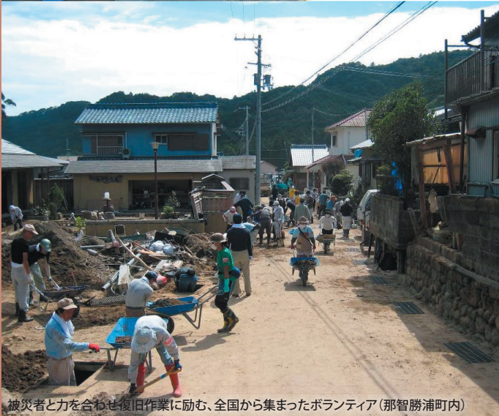
被災者と力を合わせ復旧作業に励む、全国から集まったボランティア(那智勝浦町内)