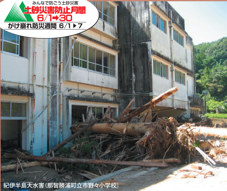
紀伊半島大水害(那智勝浦町立市野々小学校)