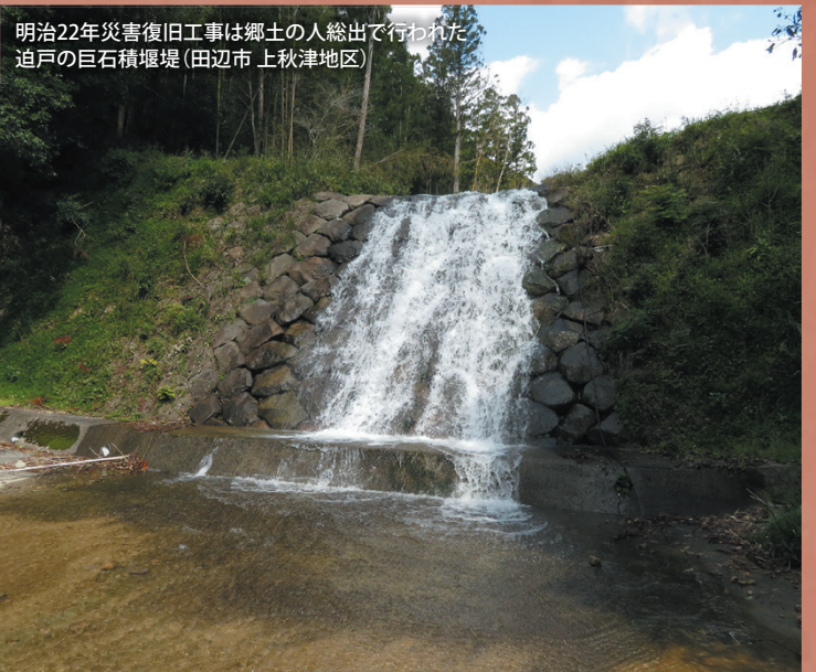
明治22年災害復旧工事は郷土の人総出で行われた 追戸の巨石積堰堤(田辺市 上秋津地区)