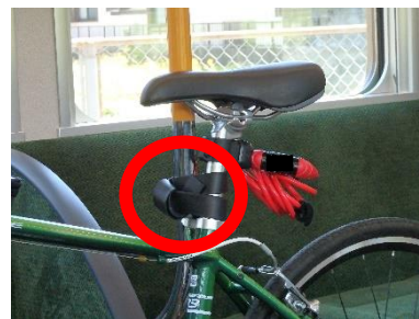
⑦ しっかりと固定してください