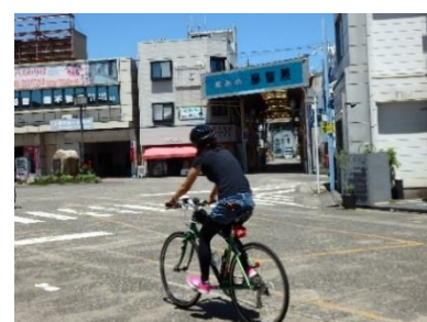
駅を出てすぐスタート♪