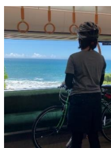
車窓からの眺めも最高！