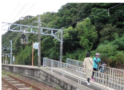
④ 譲り合って移動してください