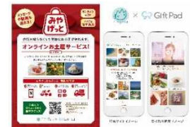
みやげっとdeプレミアム和歌山