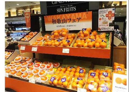
みかん・柿の販売コーナー(三越銀座店)