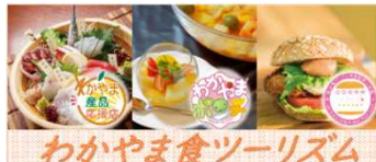
わかやま食ツーリズムバナーとQRコード