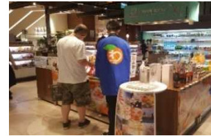
台湾での和歌山フェア