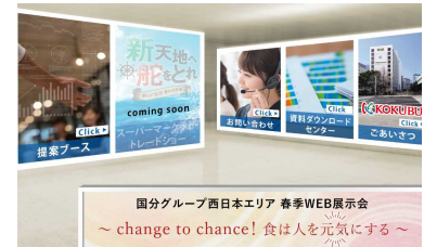
国分西日本 春季WEB展示会