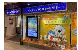
物産店舗出店 (阪急大阪梅田駅構内)