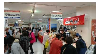
山形屋「第9回 三重・和歌山・奈良の物産展」 (2020.2.19～25)