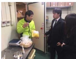
メーカーの产地視察