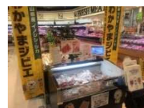
スーパーでジビエ販売