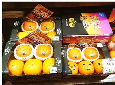
高級百貨店での県産果実の販売 ハロウィンパッケージ(三越日本橋本店)