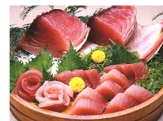
びんちょうまぐろ