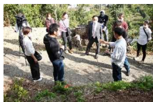
シェフの产地視察