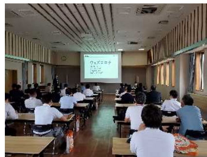
各種セミナーの開催