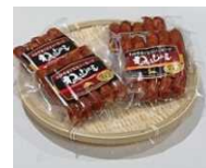
ジビエソーセージ