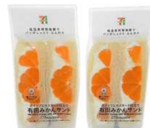
(株)セブン-イレブン・ジャパン