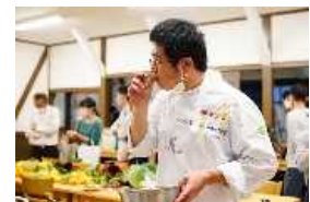
トップシェフによるデザート提案