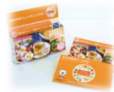
わかやま食ツーリズムPR用カード