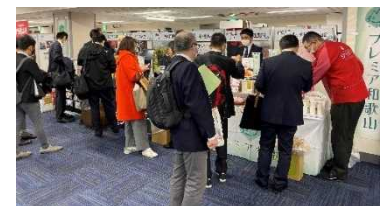
第10回通販食品展示商談会