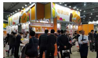
スーパーマーケット・トレードショー2020