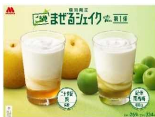
(株)モスフードサービス