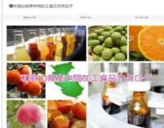
県産中間加工食品カタログ