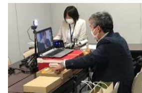
わかやま産品商談会in大阪「Web版」