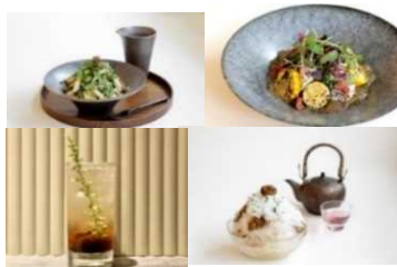
Cosme Kitchen Adaptation