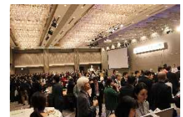
PRイベント(椿山荘) (2019の様子)