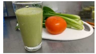
県産食材の美味しい食べ方レシピ