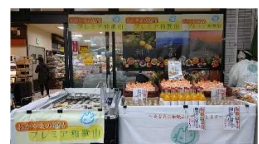
千葉県のスーパーでの「和歌山フェア」