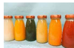
わかやまスムージー