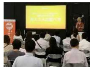
セミナーでの機能性情報の発信