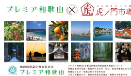
通販サイト「虎ノ門市場」