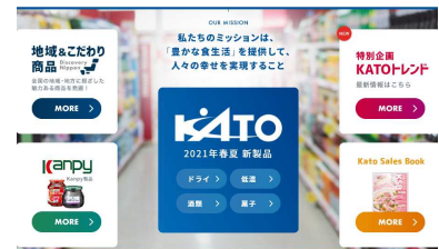
KATO VIRTUAL EXPO ～新製品提案Webサイト～