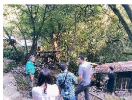
料理専門誌による取材