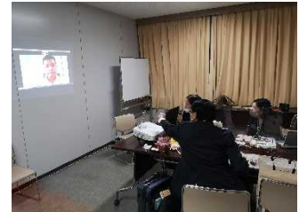
ベトナムバイヤーとのWeb商談会