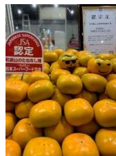
スーパーフード「柿」のPR