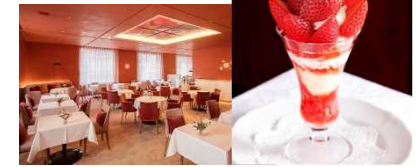
資生堂パーラー銀座本店