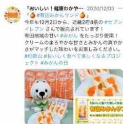
(SNSを活用した情報発信)