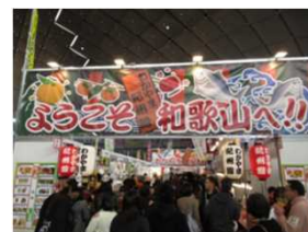
ふるさと祭り東京 会場