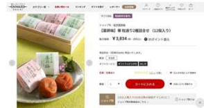
通販サイト「オンワード・マルシェ」