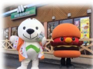
(メーカーと協働したPR)