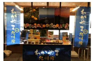
わかやま紀州館mini 1号店 (クレイン大阪) の様子