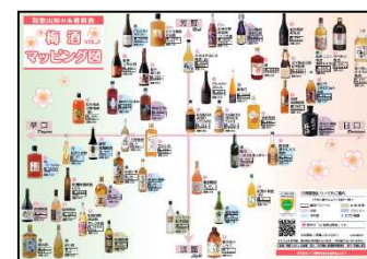
46種の本格梅酒 「梅酒マッピング図Vol.2」

本格梅酒のうち、一定の生産基準を満たし品質が保証されているとして「GI和歌山梅酒管理委員会」の審査により認められた梅酒