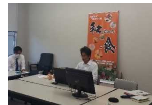
マカオレストランシェフとのWeb商談会