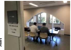
高級スーパーとのWeb商談会