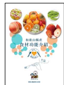
和歌山県産食材機能性ガイド (繁体字)