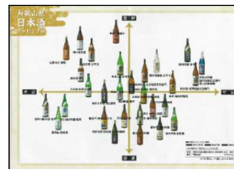
30種類の日本酒マッピング図