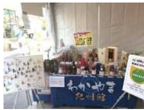
2020“よい仕事おこし”フェア (羽田空港)