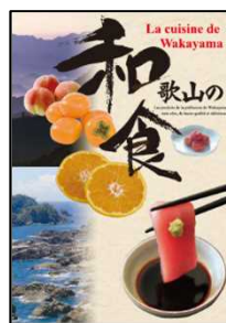
和歌山の食 (フランス語・ベトナム語)

※テロワール: フランス語で生育地の地理、地勢、気候、こだわりの栽培法や確かな技術により栽培される農作物の生育環境を指す