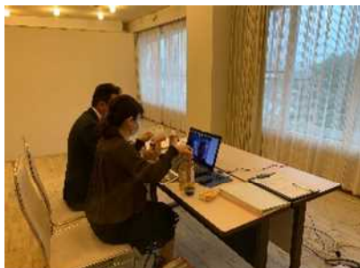
小売バイヤーとのWeb商談