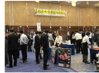
わかやま産品商談会in和歌山