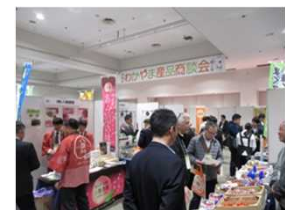
わかやま産品商談会in大阪