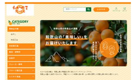
紀州館オンラインショップ