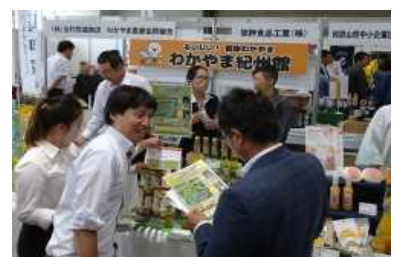
三井食品関西メニュー提案会2019