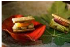
柿のバターサンド