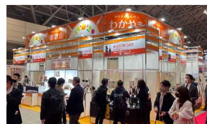
FOOD EX JAPAN 2021