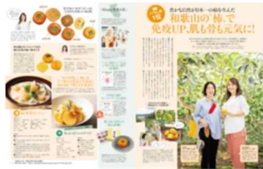
美ST12月号 タイアップ誌面、取材風景