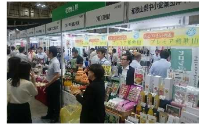
三井食品フードショー2019