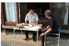
通販テレビ番組「虎ノ門市場」撮影現場

拡大する通販市場に対応するため、通販テレビ番組の活用や有名通販サイトのフェリシモ等への提案により県産品のさらなる認知拡大・売上向上を図る。