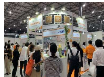
ダイエット&ビューティーフェア2020