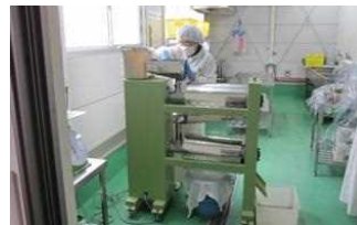
コンビニ商品開発担当者の工場視察