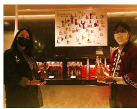
和歌山梅酒フェア (新宿伊勢丹)