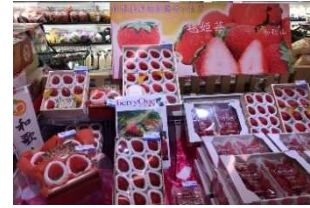
香港でのまりひめフェア