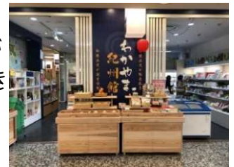
わかやま紀州館店頭