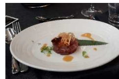
レストランフェアのイメージ