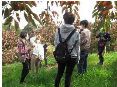
トップパティシエの柿の産地視察