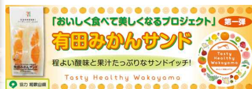
(コンビニと協働した販促資材によるPR)