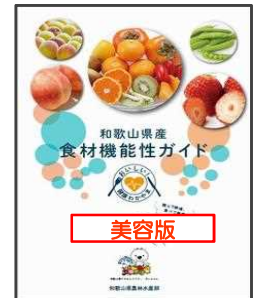
機能性ガイド「美容版」