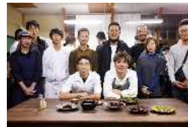
県産食材を使用したワークショップ