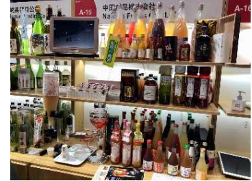
第3回中国国際輸入博覧会