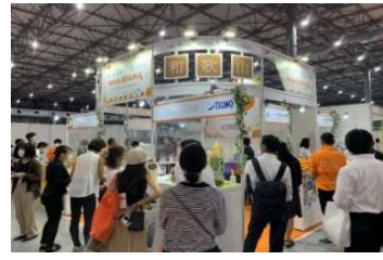
「ダイエット&ビューティーフェア2020」