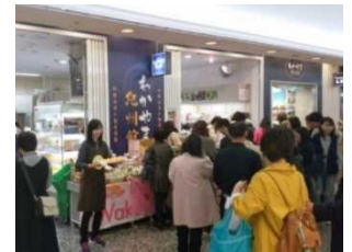
わかやま紀州館店頭販売の様子