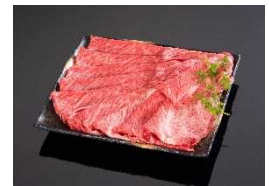
令和2年度審査員特別賞 《紀州和華牛》