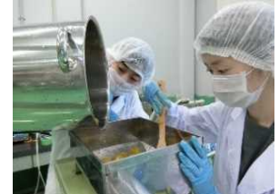
フードプロセッシングラボ （工業技術センター）