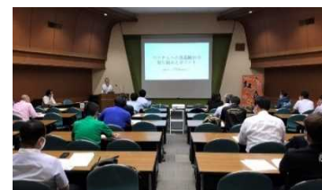
ベトナム向け食品輸出セミナーの様子