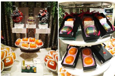
新品種「紀州てまり」の首都圏出荷PR販売(伊勢丹新宿店)