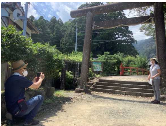
8/1 試行ツアー 現地の様子