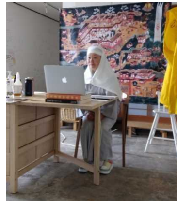
8/1 試行ツアー スタジオの様子