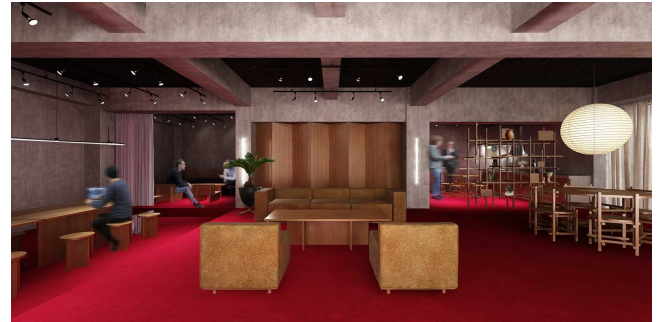
《コワーキングルームイメージ》