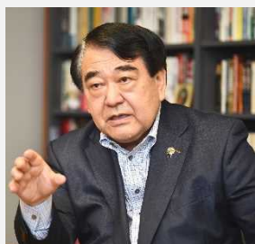
寺島 実郎 氏