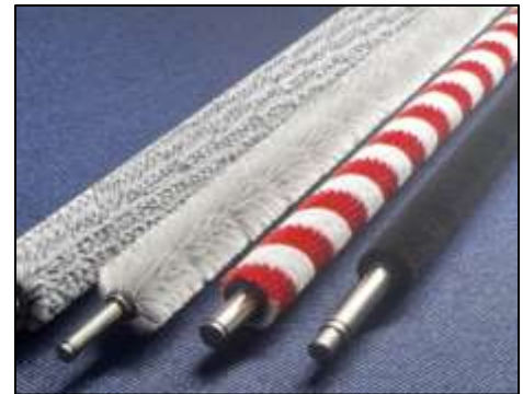
クリーニングブラシ （ロールブラシ）