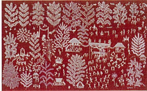
5. ジヴァ・ソーマ・マーシェ 《村の結婚式》1994年