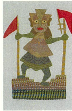
7. ジャンガル・シン・シュヤム 《チャーンディー女神》1999年