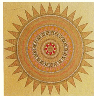
3. ゴーダーワリー・ダッタ 《チャクラ》1990年