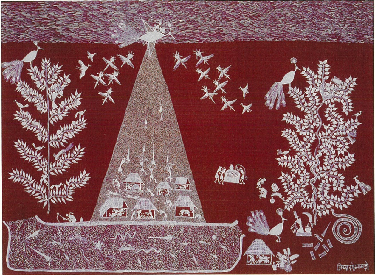
1.ジヴヤ・ソーマ・マーシェ《パールから生まれた娘》1996年