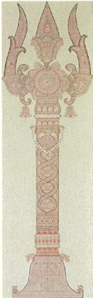
4. ゴーダーフリー・ダッタ 《トゥリシューラ》 1994年