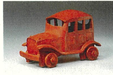
8. ララ・バンディット 《自動車》2005年