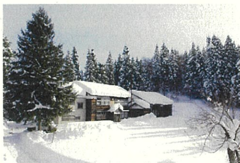
ミティラー美術館 (新潟県十日町市)

本展覧会ではミティラー美術館の協力を得て、同館のコレクションから約50点を紹介します。コスモロジーあふれるインド美術の魅力に触れていただくことで、和歌山県とインドの友好を深める機会としたいと思います。