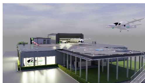
離着陸場イメージパス