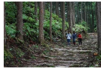
熊野古道トレッキング