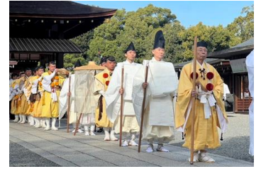
昨年度の京都・城南宮 出立式の模様