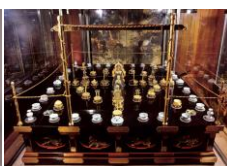
那智山青岸渡寺 (那智の秘宝・秘仏 特別公開など)