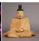
熊野那智大社 (宝物の特別展)