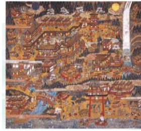
熊野那智参詣曼荼羅 (熊野那智大社蔵)