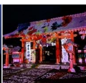
熊野速玉大社 (プロジェクション マッピングなど)