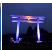
熊野本宮大社 (大斎原大鳥居 ライトアップなど)