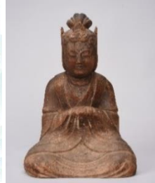
女神（丹生明神） 坐像（龍谷寺蔵）