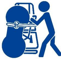
車内では座席に立てかけゴムで固定