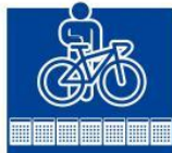
自転車も黄色の点字ブロック内側で