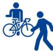
すれ違うときは歩行者優先で