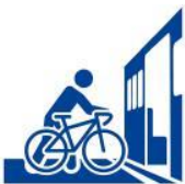
駅や車内では自転車に乗らないで