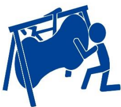
乗車時は専用カバーをかけて