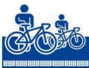
小学生以下の方は大人と一緒にご利用