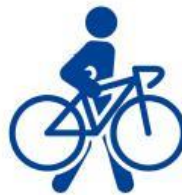
持ち運びはお客様ご自身で他のお客様と距離をあけて