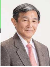
和歌山県知事 仁坂 吉伸

1974年東京大学経済学部卒業。同年4月に通商産業省に入省。大臣官房審議官（通商政策局担当）、製造産業局次長等を歴任。2003年7月ブルネイ国大使に就任。2006年12月に和歌山県知事に就任、2020年12月に関西広域連合長に就任、現在に至る。