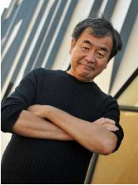
建築家 東京大学 特別教授・名誉教授 隈 研吾

1974年東京大学経済学部卒業。同年4月に通商産業省に入省。大臣官房審議官（通商政策局担当）、製造産業局次長等を歴任。2003年7月ブルネイ国大使に就任。2006年12月に和歌山県知事に就任、2020年12月に関西広域連合長に就任、現在に至る。