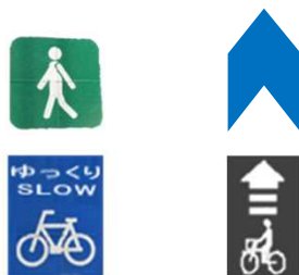
歩道への路面表示 車道への路面表示