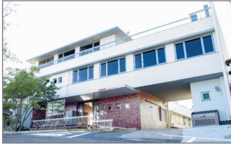
ITビジネスオフィス 「ANCHOR」(アンカー)