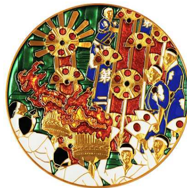
七宝章牌「那智の扇祭り」