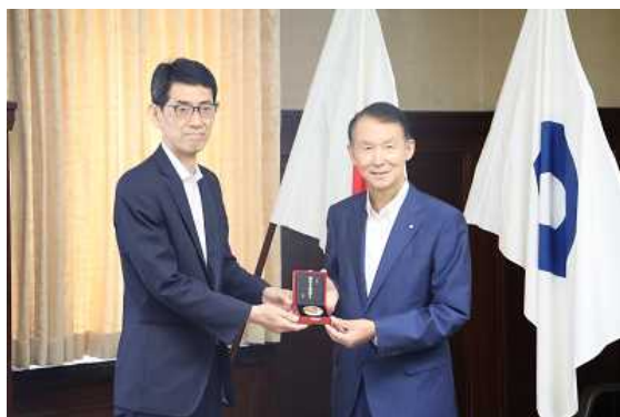
贈呈の様子（後藤理事長、知事）

精巧な技術をもつ熟練した職人が、細心の注意を払って製造した、造幣局の技術が詰まった美しい工芸品です。