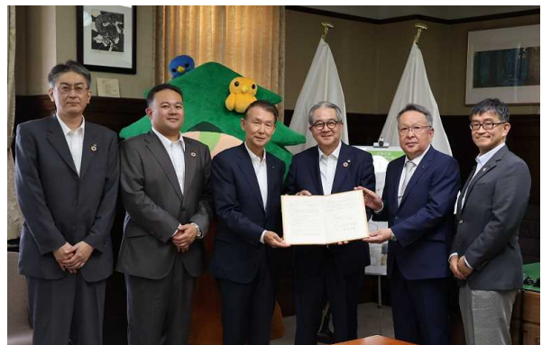
株式会社日本化学工業所、龍神村森林組合、田辺市、和歌山県による記念撮影